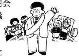
人間性が大切です

この時期は、他市の市議会第3定例会（9月議会）は、ほとんど閉会となっていますが、船橋市議会の閉会は10月5日です。本日開催の議会運営委員会で、明日29日の本会議で、今回の衆議院議員選挙及び最高裁判所裁判官国民審査を執行するための補正予算が提案され、即日採決することになりました。そして、29日の本会議で他の議案に先駆けて審議・採決が行われ、全会一致で可決されました。