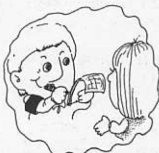
本当に追跡調査してる？

次に、マンション等大規模開発をする際に、公園用地として市に寄付する土地の半 分をそのまま蓄積しておき、何カ所かまとまった時に、 1ヶ所でまとまった土地を持っている人との間で代替用 地として交換すれば保育園用地として活用でき、建設費 のみで済むのではないかと提案しました。