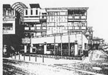
ケア・リハビリセンター

①飯山満町2丁目にある「ケア・リハビリセンター」は豪華マンションを思わせる施設です。ここは「ケアハウス」と「リハビリセンター」の2本立てになっています。