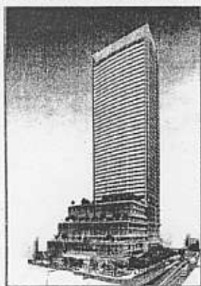
豊島区役所イメージ図

東京の豊島区では、区庁舎の建替えに民間の力を借りることになりました。地下3階、地上48階の高層マンションを建て、9階までを区役所が使用し、10階以上を分譲マンションとします。建て替える場所は現在の区庁舎の近くの小学校跡地です。現在使用している区庁舎は民間に貸し出し、新庁舎建設費の際に一時負担はあるものの、新庁舎が完成しても負担があるどころか、最終的に10億円が区の収入と